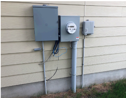
Líneas Subterráneas Conectadas a Medidor Eléctrico

CPS Energy se encuentra entre los principales compradores públicos de energía eólica de la nación y San Antonio y es el #1 en Texas en capacidad de energía solar.