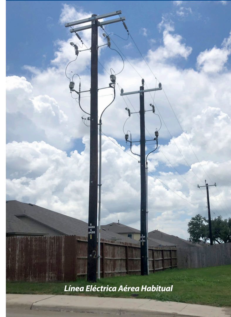
Línea Eléctrica Aérea Habitual

FIABILIDAD | ACCESIBILIDAD PARA EL CLIENTE | TRABAJAR SEGURO SEGURIDAD | RESPONSABILIDAD AMBIENTAL | FORTALEZA